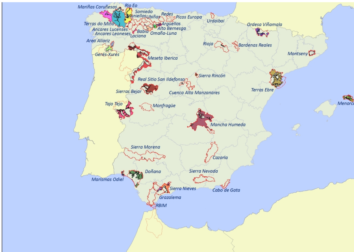
Figura: Las Red Española de Reservas de la Biosfera (Península) en relación a los territorios sin más figuras de protección que los de la propia reserva (polígonos coloreados) en base a la cartografía disponible en el Banco de Datos de la Naturaleza del Ministerio para la Transición Ecológica.